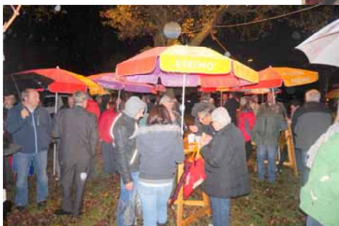
Anschließend gemütliches Beisammensein