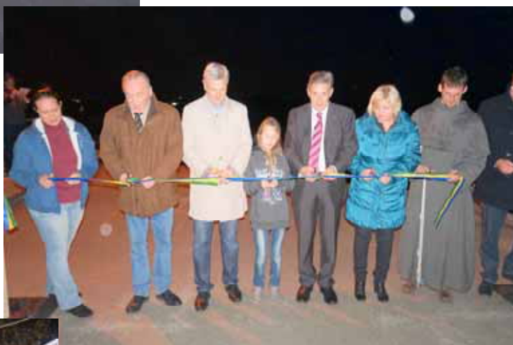
Der historische Augenblick, die Brücke wird eröffnet.