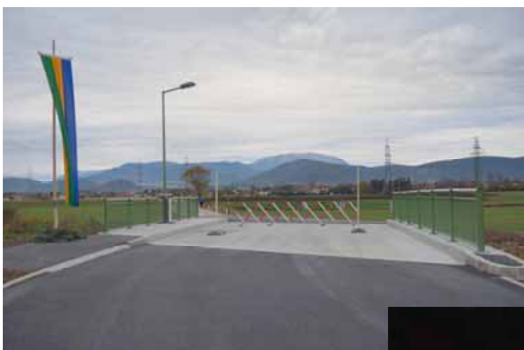
Brücke vor Eröffnung

Die zahlreich erschienene Bevölkerung ließ sich auch durch den strömenden Regen nicht von der Teilnahme abhalten und die Bewirtung durch das Burggasthofteam gut schmecken.